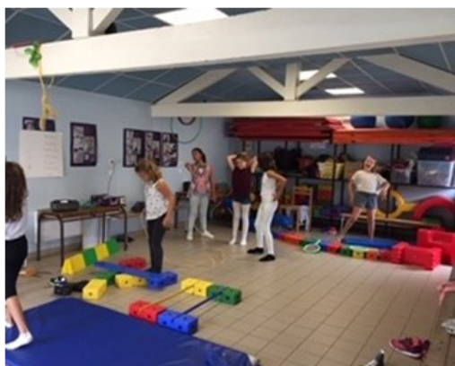
jeux de motricité