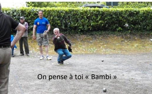
On pense à toi « Bambi »

Saison 2019 terminée, elle a été identique aux autres années: du bon et du moins bon.