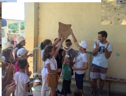
Tournois de dodge ball