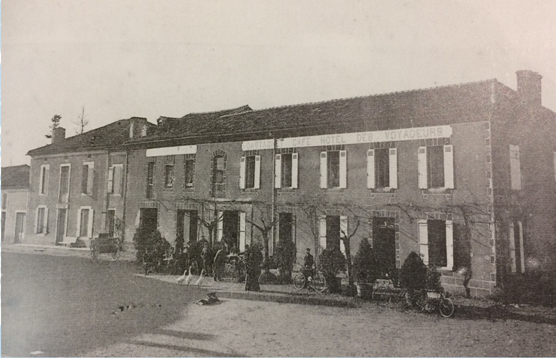
CASTELNAU D'AUZAN / Café et Hôtel des Voyageurs L'hôtel des Voyageurs de Castagnet deviendra plus tard le Foyer Municipal