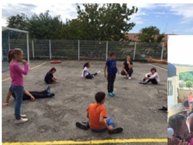
Lucky Luke avec les grands