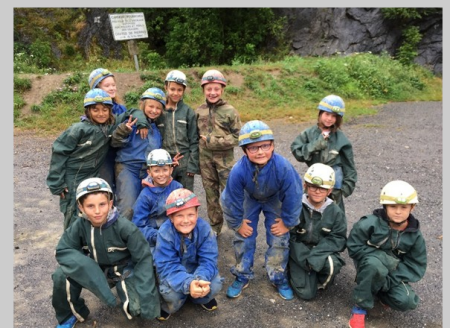
Camp d'été à la montagne, sortie spéléologie