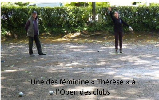
Une des féminine « Thérèse » à l'Open des clubs