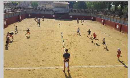
La CCGA Dodge Ball Cup, pour la 2 ème année consécutive