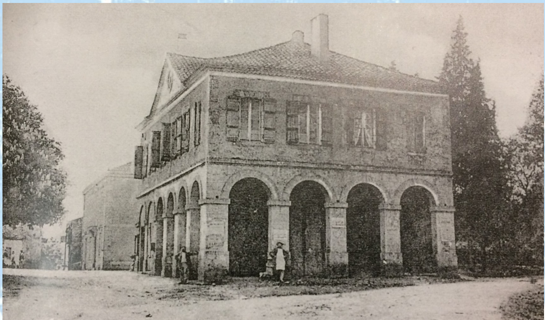
LABARRÈRE / La Mairie et la Place La mairie abritait également l'école