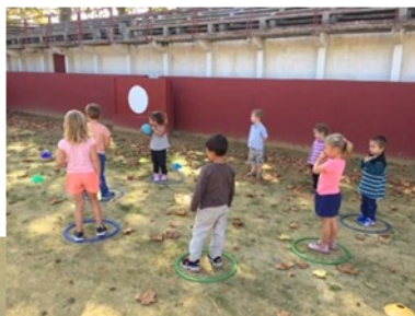
jeux dans les arènes avec les petits