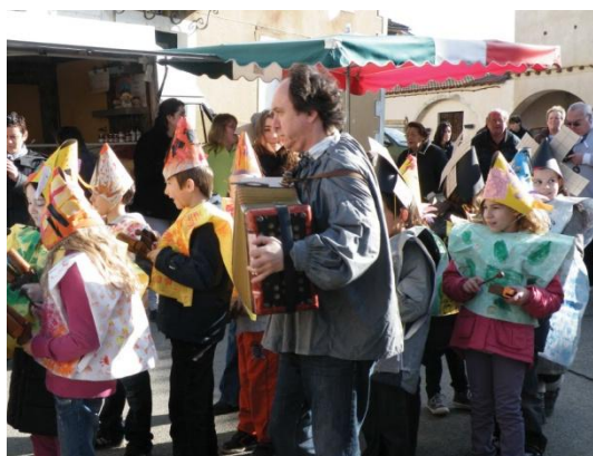
Le défilé de Carnaval. C'est jour de marché, l'école et son intervenant en musique animent Castelnaud.