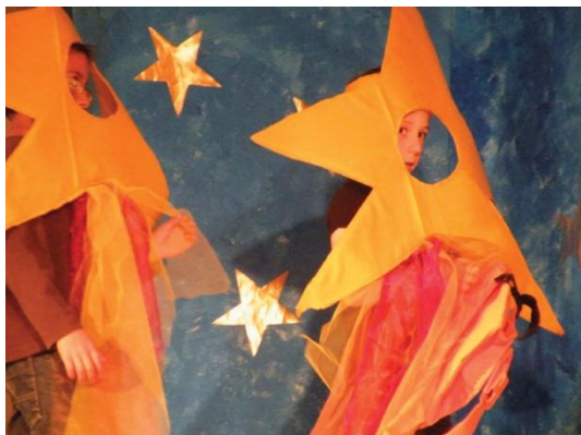
Les élèves de grande section-C.P. présentent « la petite étoile » aux familles, puis au club du troisième âge.