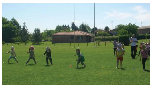
Rencontre sportive inter-écoles au stade de Castelnaud. Au programme: course, saut en longueur, lancer, relais gersois.