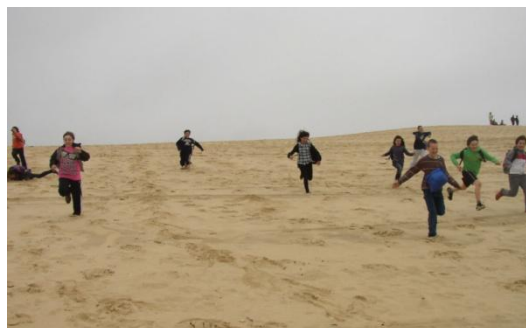
En avant pour la descente de la dune du Pyla! Les grands en classe de découverte autour du bassin d'Arcachon.