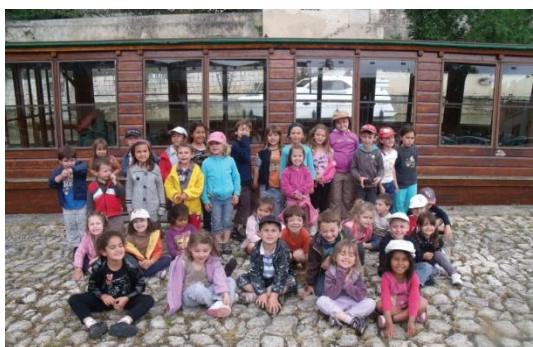
Les enfants de maternelle et de GS/CP devant le bateau « Le Prince Henry » à Nérac, à l'occasion de leur journée dans le Lot et Garonne (musée d'Agen, visite du parc de Garenne et mini-croisière sur la Baïse)

L'année prochaine, nous reconduirons les événements qui rythment l'année tels que la soirée théâtre, le défilé costumé, le spectacle de fin d'année