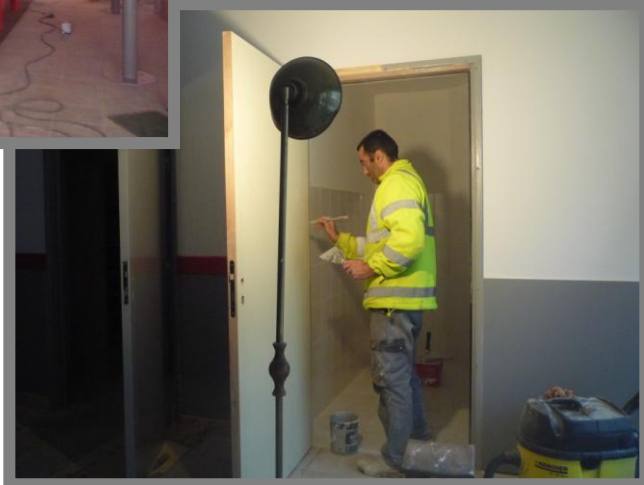
Café des sports