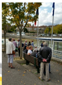
Photos de la sortie du 2 Octobre 2015 Croisière sur la Baise par la Société Florilège