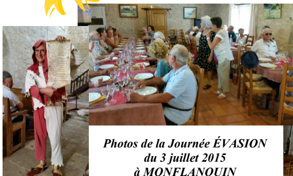
Photos de la Journée ÉVASION du 3 juillet 2015 à MONFLANQUIN

Début du mois de juillet 2016 : journée "ÉVASION", à définir.